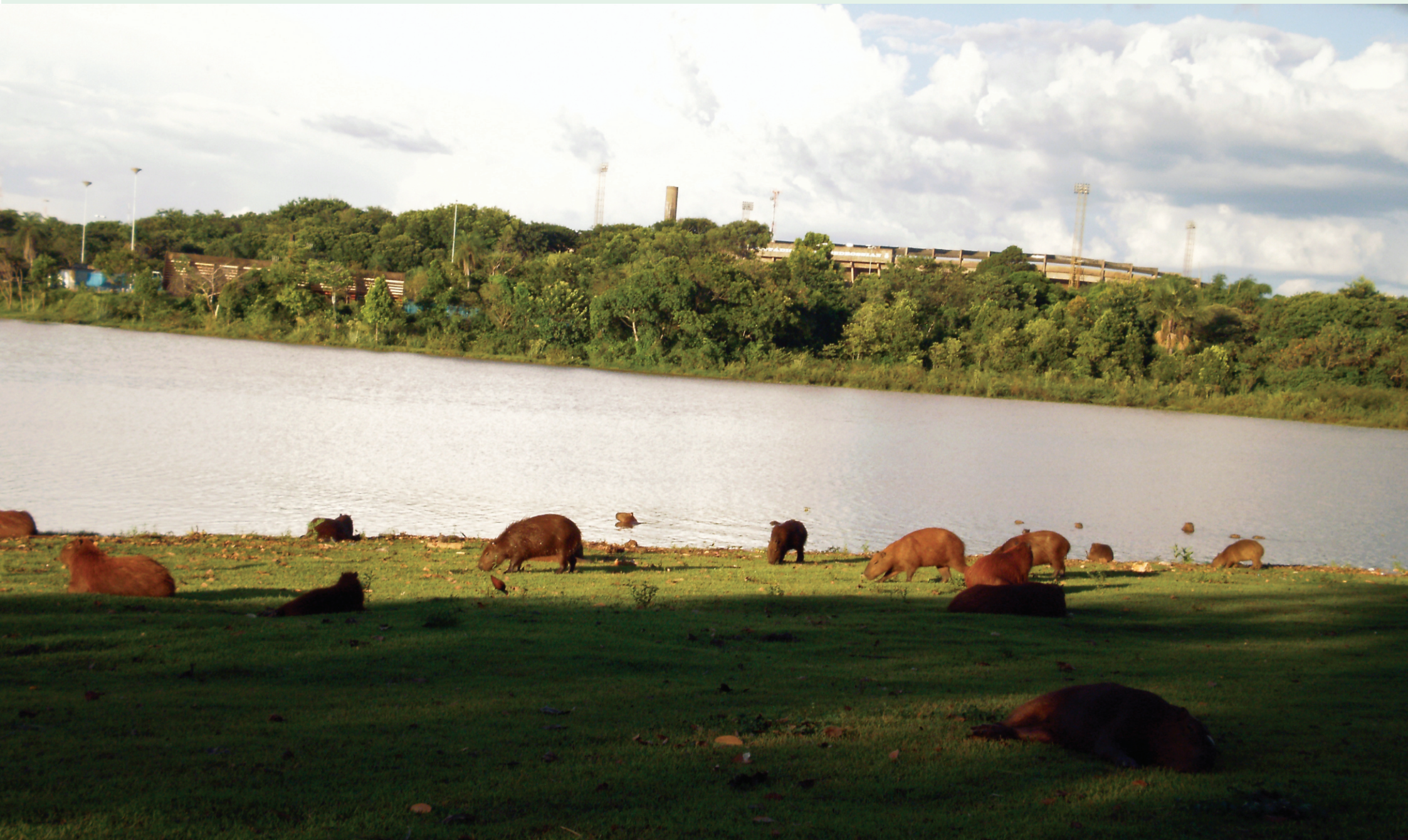
A UFMS conta com locais como o Lago do Amor, espaço para lazer da comunidade que permite também o desenvolvimento de pesquisas científicas

As obras e projetos de revitalização da infraestrutura têm como objetivo manter o ensino de qualidade oferecido e fortalecer a interface entre ensino, pesquisa e extensão. Pág. 4