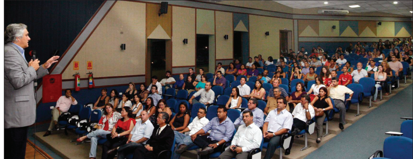
Vice-Reitor participa da recepção aos calouros na Cidade Universitária, em Campo Grande, e no câmpus do Pantanal, em Corumbá, o Senador Delcídio do Amaral profere a aula magna